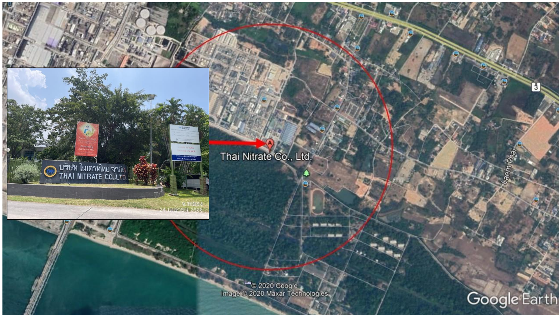
รูปที่ 1.2-1 แผนที่แสดงที่ตั้งโครงการ